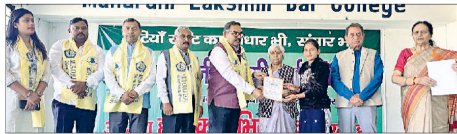
हिसार। छात्रा को प्रमाण पत्र वितरित करते अतिथिगण।