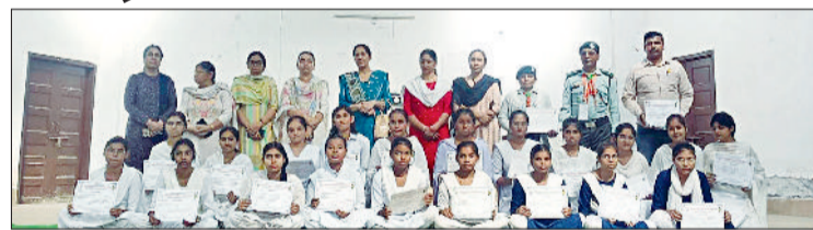
हिसार। प्रमाण पत्र करते करते अतिथिगण।