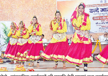
फोटो: सांस्कृतिक कार्यक्रमों की प्रस्तुति देती छात्राएं तथा कार्यक्रम को संबोधित करते विधायक रणधीर पनिहार।

वंदे मातरम राष्ट्रीय गीत के 150 वर्ष पूर्ण होने पर शुक्रवार को सिरसा के पंचायत भवन में जिला स्तरीय स्मरणोत्सव का आयोजन किया गया। कार्यक्रम में नलवा विधानसभा के विधायक रणधीर पनिहार ने बतौर मुख्यातिथि शिरकत की। इस अवसर पर प्रधानमंत्री नरेंद्र मोदी के दिल्ली में आयोजित राष्ट्रीय कार्यक्रम तथा अंबाला में मुख्यमंत्री नायब सिंह सेनी के राज्य स्तरीय कार्यक्रम का लाइव प्रसारण किया गया। अतिथियों ने वंदे मातरम प्रदर्शनी का भी अवलोकन किया। विधायक रणधीर पनिहार ने