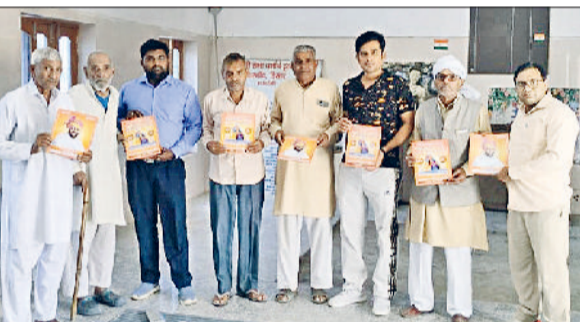
नारनौल। महाराजा शूरसैनी जयंती समारोह का न्योता देते हुए।