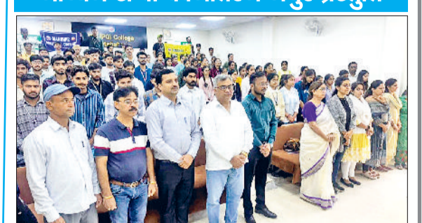
फतेहाबाद। कार्यक्रम में वंदे मातरम दी मधुर प्रस्तुति देते विद्यार्थी व उपस्थित प्राचार्य तथा स्टाफ सदस्य।