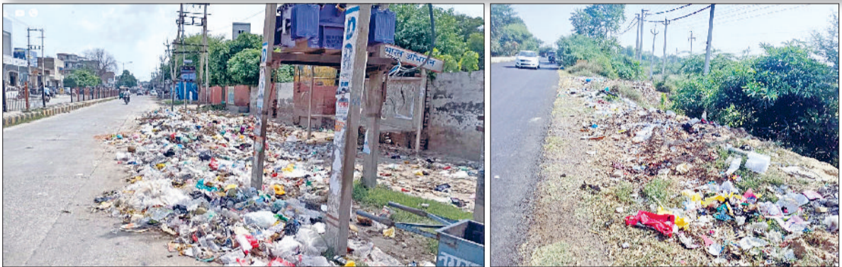
फतेहाबाद। मिनी बाईपास पर सड़क किनारे लगा कचरे का ढेर तथा अवैध डंपिंग स्टेशन पर बिखरा कचरा।

नेशनल हाईवे व बाईपास पर सड़क किनारे कई जगह अवैध डंपिंग प्वाइंट बन गए हैं। इससे पर्यावरण व हाइवे की सुंदरता पर बुरा असर पड़ रहा है। राहगीरों का बद्बू से जीना मुहाल।