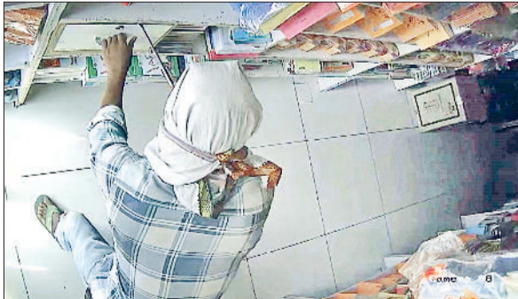
हिसार। स्टेशनरी की दुकान में गल्ले को तोड़ता चोर सीसीटीवी में कैद।