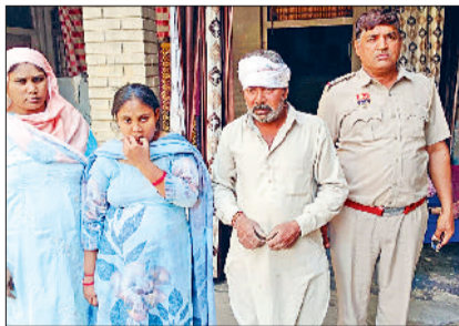
रतिया। मंदबुद्धि युवती को परिजनों के सुपुर्द करते पुलिस कर्मचारियों।