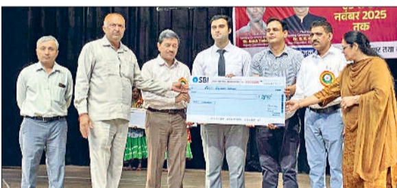
हिसार। लुवास टीम को सम्मानित करते अधिकारी।

बहुत ठंडा या गर्म पानी का सेवन करने से बचें। सॉफ्ट टूथब्रश का इस्तेमाल करें। 24 घंटे में कम से कम दो बार ब्रश करें और दांतों की नियमित रूप से दांतों की जांच करवाएं। इस मौसम में खान पान का भी दांतों पर असर पड़ता है। दूध, दही, पनीर और अन्य डेयरी प्रोडक्ट खा ले सकते हैं।